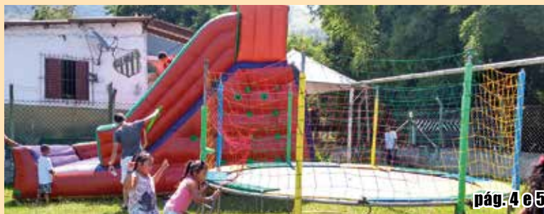
pág. 4 e 5